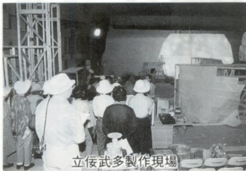
立佞武多製作現場

一つは市民への供給水が岩木川、飯詰ダム、浅瀬石川ダムの三ヶ所からなので突発的な事故でもない限り水には困らないことを知り安心しました。