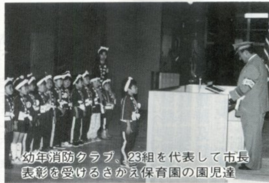
幼年消防クラブ、23組を代表して市長表彰を受けるさかえ保育園の園児達

六月五日、県消防協会北五支部の消防団観閲式が行われ、日夜、技術向上に務めている団員がオルテンシアに集いました。