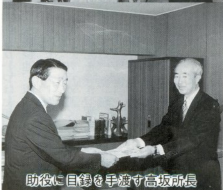
助役に目録を手渡す高坂所長