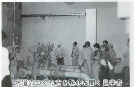
水道のつくり方を熱心に聞く見学者

このところ回転が悪くなった頭のサビがとれた一日でした。私たちのために施設見学を実施してくださった職員の方々ありがとうございました。