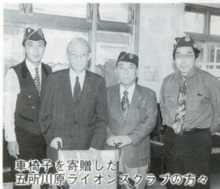
車椅子を寄贈した五所川原ライオンズクラブの方々