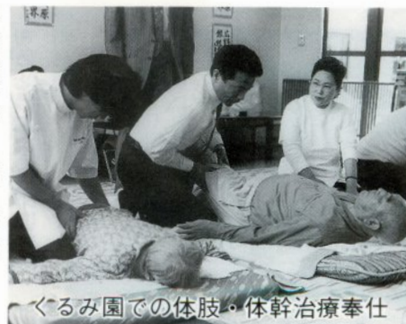
くるみ園での体肢・体幹治療奉仕