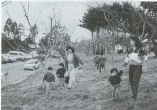
梅林を散策する市民