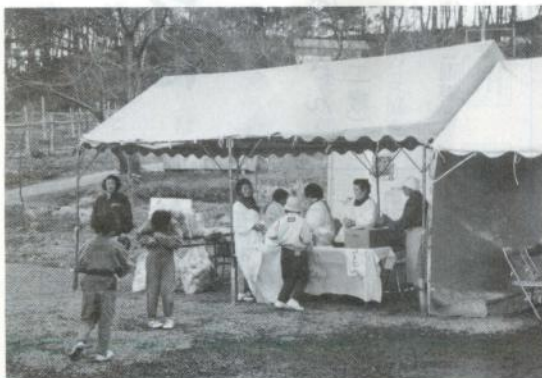
農産物加工品の展示即売