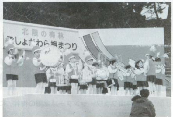
津軽野保育園児による鼓笛演奏