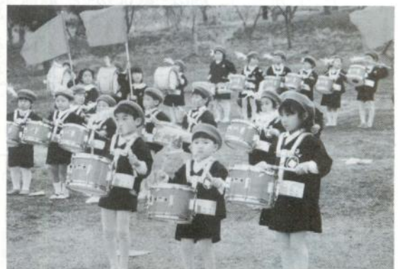
第一・第二さつき保育園児による鼓笛演奏