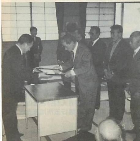
表彰状を受けるクラブ会長