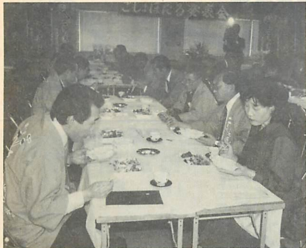
「ごしよほたる」を賞味する出席者ら