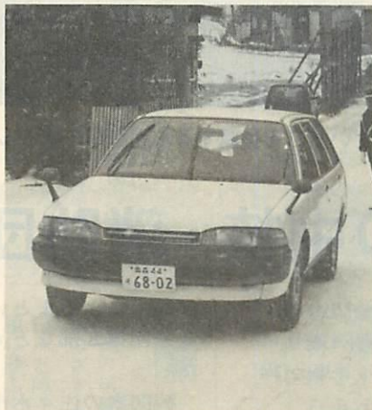
スタッドレス装着車を運転する参加者

この日は、時折雪が降りしきる絶好のコンディションとなり、参加者らは凍結路、圧雪路、坂道などのコースでスタッドレスタイヤの性能を試しました。