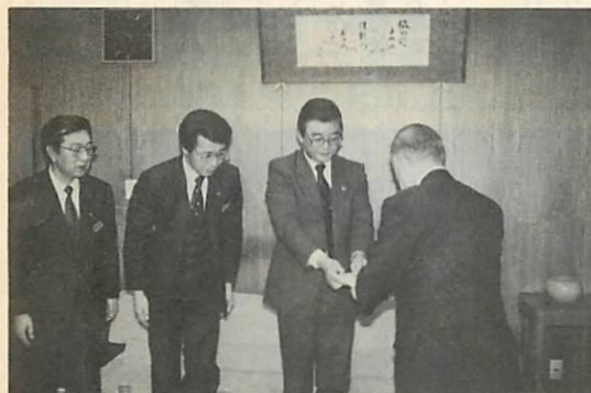
佐々木市長(右)に手渡す昭和パールの皆さん