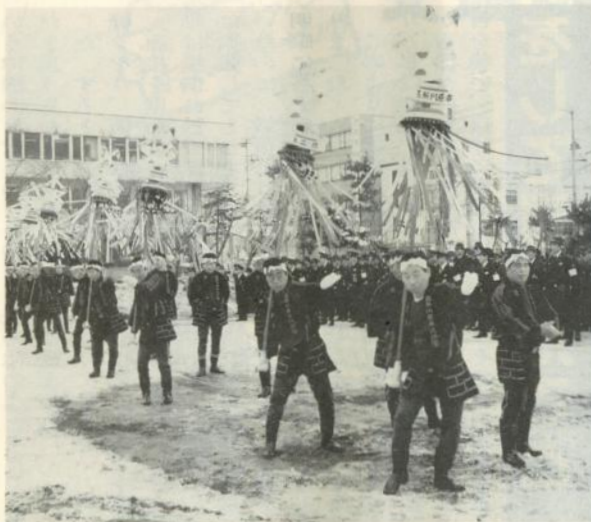
勇壮な纏(まとい)振りを披露する第一分団の皆さん