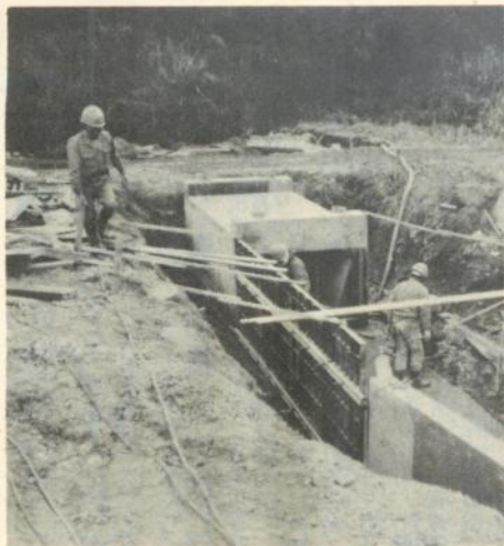
工事現場で作業する市出身の出稼ぎ者たち