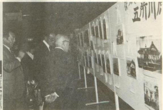
賑わっていた なつかしの五所川原コーナー