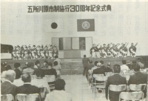
曲弾びきを披露する秀栄会のみなさん