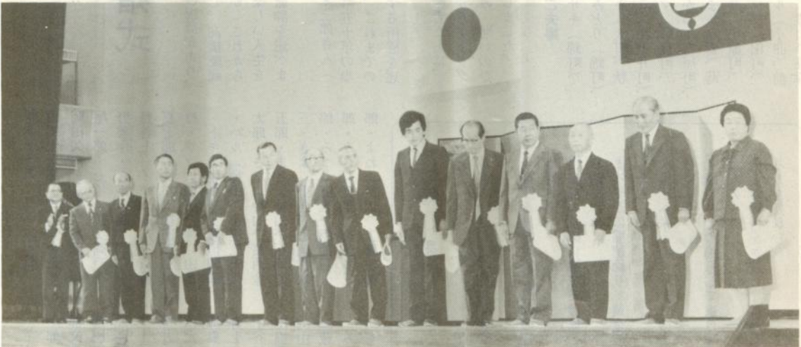
表彰されたみなさん