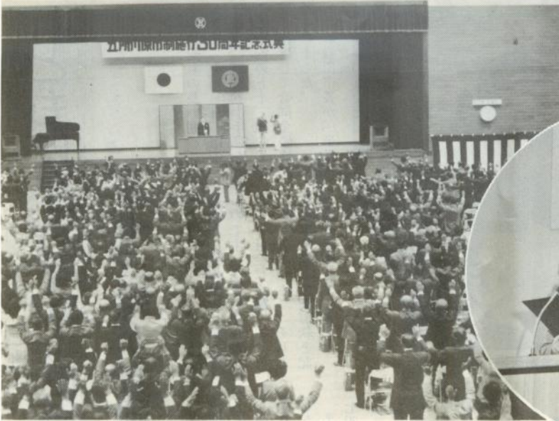
新生五所川原の門出を祝い万歳三唱