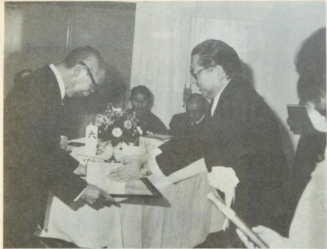
顕彰状を贈られる金婚夫婦

このあと出席者たちは、昼食をとりながらアトラクションを楽しみ、憩いのひとときを過ごしました。