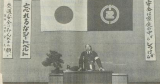
交通事故の現況を報告する地代所署長