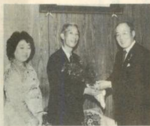
社施設に贈り続けているものです。

三井生命保険会社では十月八日、市にネズミモチ、ハナズオウの苗木合わせて千本を寄贈し、青森支社の川口外務課長らが寺田市長