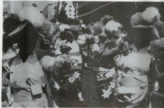
かあちゃんもいるよ