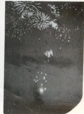
夜空をこがす花火