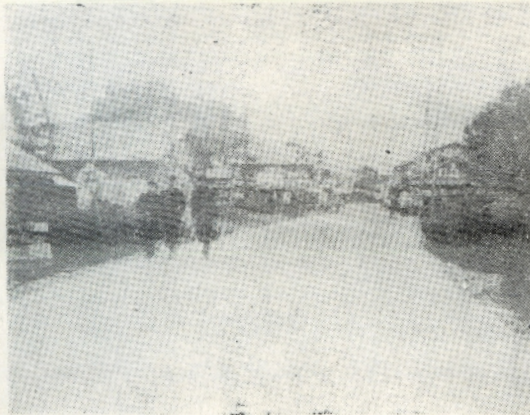
一写 真一 上...完成した新校舎 下...舗装の終わった鎌谷道

松島町に四十年十一月から総工費二億七千七百六十八万五千円をかけて建設していた、五所川原第一中学校の新校舎は、現在、工事中の屋内体操場(一、七二二平方呎)を残して完成しました。