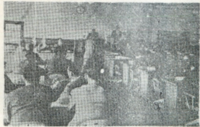
明治百年記念「頌歌」歌詞募集

大正十六年三月 五所川原尋常小学校卒業 昭和二十四年七月 栄農業協同組合長 昭和二十六年八月 栄村助役 昭和二十九年十月 五所川原市土木課長 昭和三十一年六月 北栄農業協同組合長 昭和三十六年七月 五所川原市監査委員 昭和四十二年九月 市議当選 同十月副議長に就任