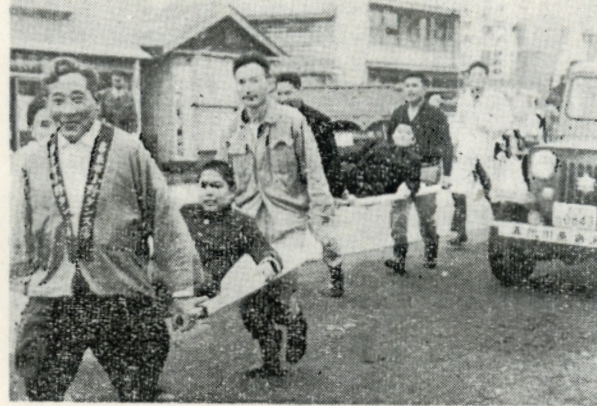
(写真…敷島分院での避難訓練)

期間中は防火対象物および一般家庭予防査察、消防自動車による火防宣傳等をして市民に火災予防の普及を図ることになっていきます。 また火災による人命の損傷防止のため電報電話局、市立西北中央病院、中三デパート、日通支店、津軽鉄道各学校、その他防火対象物の避難および消防総合訓練