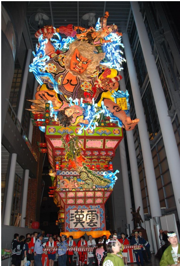
平成27年製作【津軽十三浦伝説・白髭水と夫婦梵鐘】

五所川原（ごしょがわら）の“G”をモチーフにし 青色は日本海・十三湖・岩木川の水を 緑色は津軽平野の大地の恵みを 赤色はリンゴと太陽をそれぞれ象徴し 豊かな自然を背景に生き活きと未来に活躍 する姿をイメージしています。