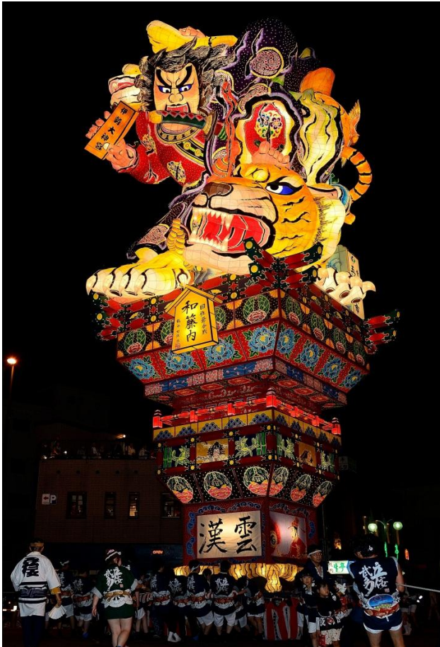
平成26年製作【国性爺合戦 和籐内】

五所川原（ごしょがわら）の“G”をモチーフにし 青色は日本海・十三湖・岩木川の水を 緑色は津軽平野の大地の恵みを 赤色はリンゴと太陽をそれぞれ象徴し 豊かな自然を背景に生き活きと未来に活躍 する姿をイメージしています。