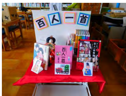
五所川原第三中学校図書館テーマ展示の様子

各教科等の資料の活用、委員会活動、部活動などの教育活動における学校図書館機能の利用等を通して、学習支援機能の整備を図っていきます。