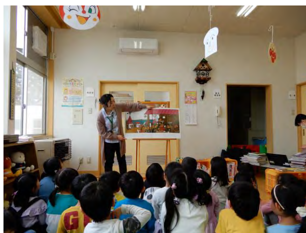
子育て支援センターでの図書館司書による読み聞かせの様子