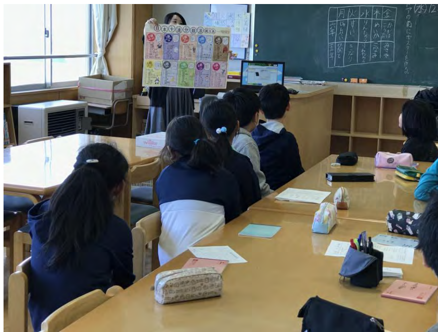
三輪小学校図書委員への図書館システムなどの説明会の様子

学校図書館運営・活動の中心的役割を担う司書教諭の指導時間の確保と学校司書の配置、そして更なる蔵書の充実が課題といえます。