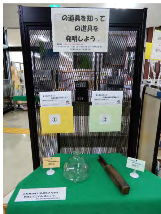
市立図書館における図書館資料活用につながる 夏休み企画展の様子

また、子どもの健やかな成長に対する絵本の影響力や、子どもと本を結びつける読み聞かせ活動の効果に対する理解を深める機会を提供することにより、地域ぐるみで子どもの読書環境づくりを推進する機運を高めることを目的とした、子どもの読書活動の推進を図る啓発活動に努めます。