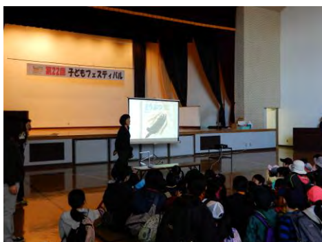
ごしよがわら子ども読書活動推進実行委員会による子どもフェスティバルでの読み聞かせの様子

これまでの経験と共通の思いがつながることで、子どもの読書活動は効果的に推進していきます。協力関係を更に強化し、具体的な方策を推進するとともに体制の整備を図っていくことが課題といえます。