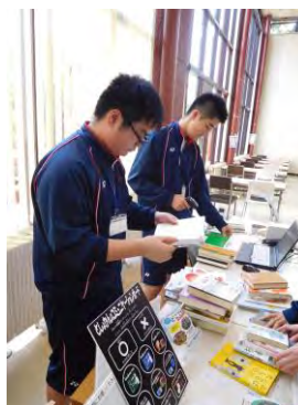
市立図書館での五所川原第一中学校職場体験の様子