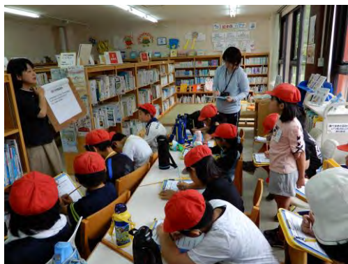
栄小学校3年生の市立図書館見学の様子

子どもの読書サービスを推進するため、児童サービスに関する研修に参加し、先進的なサービスを展開している図書館を訪問して知識を深めてきました。より充実した子どもの読書サービスを目指すためには、司書全員のスキルアップと、得た知識・経験を地域で活動するみなさんへ伝えることが課題といえます。