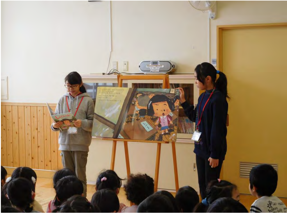
子ども司書による認定こども園でのおはなし会