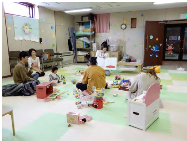
地域子育て支援拠点での図書館司書によるブックトークの様子

保護者自身が読書に親しむことや、読書が生活の中に位置付けられるように誘導していくことが課題といえます。