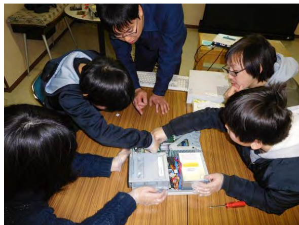
行政機関との共催による図書館の本でやって みた「パソコンを分解・組み立てしてみよう」 の様子