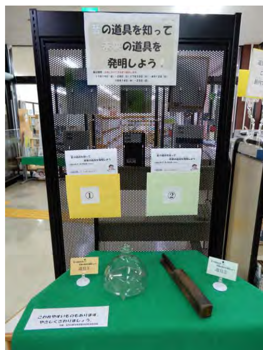
市立図書館における図書館資料活用につながる夏休み企画展の様子

また、子どもの健やかな成長に対する絵本の影響力や、子どもと本を結びつける読み聞かせ活動の効果に対する理解を深める機会を提供することにより、地域ぐるみで子どもの読書環境づくりを推進する機運を高めることを目的とした、子どもの読書活動の推進を図る啓発活動に努めます。