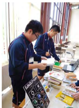
市立図書館での五所川原第一中学校職場体験の様子