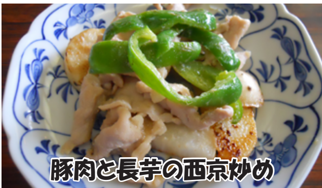
豚肉と長芋の西京炒め