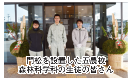
門松を設置した五農校森林科学科の生徒の皆さん

集団予防接種によりB型肝炎ウイルスに持続感染された方へ一人でも留まらずに無料相談会をご利用ください