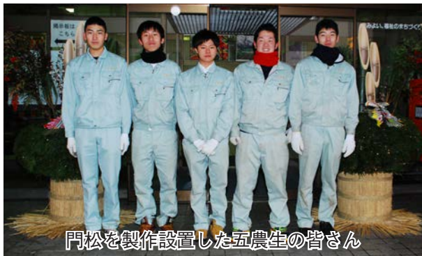
門松を製作設置した五農生の皆さん