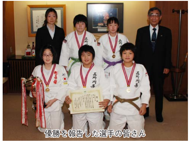
優勝を報告した選手の皆さん