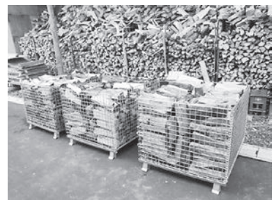
(幅1200×奥行1000×高さ900mm) メッシュパレット=軽トラック約1台分

※配送料 (パレット一台につき) 旧五所川原市内 …… 800円 つがる市、北郡 …… 1,200円 青森市、弘前市 …… 1,500円