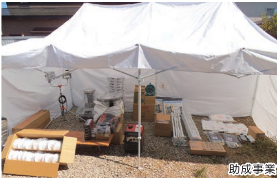
助成事業で整備した資機材・備品等