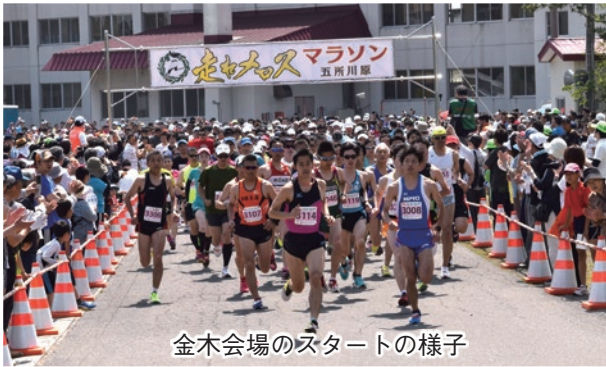
金木会場のスタートの様子

今年で第5回目を迎えた「走れメロスマラソン」が、5月29日、晴天のもとに開催され、過去最高の2075名のランナーが日頃鍛えた健脚を競いました。 ランナーは、中学生による吹奏楽の演奏、立佞武多の囃子の演奏、小学生高校生による津軽三味線の演奏や、何よりも地元住民の方々の温かい声援により完走するとともに、当市の魅力に触れていました。 また、地元の児童生徒やスポーツ団体など約900名の方が給水等のボランティアとして参加し、走れメロスマラソンを盛り上げました。