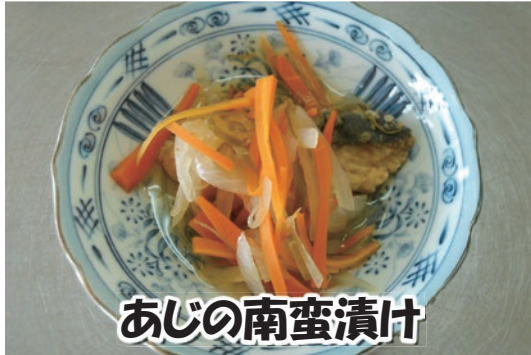
あじの南蛮漬け 1人分 212kcal 食塩相当量 1.0g