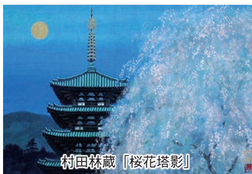
村田林蔵「桜花塔影」