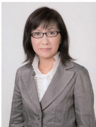
講師の香山リカ氏