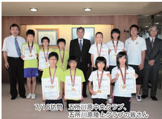
7/18訪問 五所川原中央クラブ、五所川原陸上クラブの皆さん