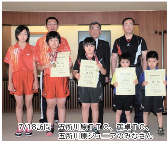
7/18訪問 五所川原TTC、鶴卓TTC、五所川原ジュニアのみなさん