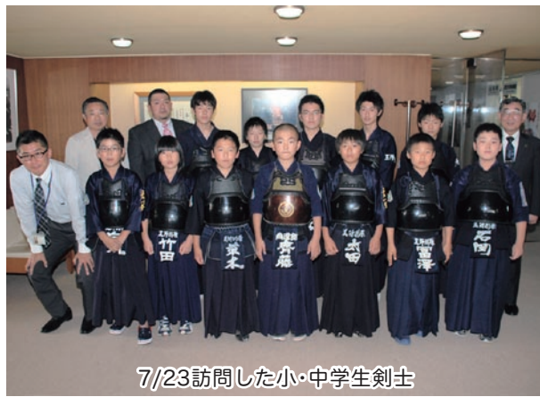
7/23訪問した小・中学生剣士