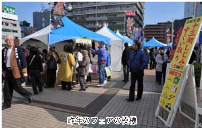
昨年のフェアの様様

毎年好評、船橋市民からも愛されている「青森県津軽観光物産首都圏フェア」を開催し、当市の観光物産をPRしてきます！