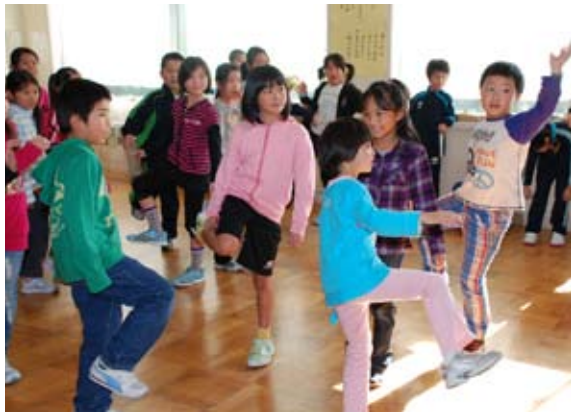
アトラクションでふれあう4小学校児童

11月1日、飯詰小学校にて、4校児童ふれあい交流会が開催され、4月に「いずみ小学校」として統合する、飯詰小、一野坪小、沖飯詰小、毘沙門小の4小学校の全校児童が参加しました。 交流会では、青森山田高校体操部の演技を觀賞したり、学年ごとに分かれての自己紹介やアトラクションを楽しんだほか、児童全員で合唱を行うなど、来春からの新たなスタートに向け、ひと足早く親睦を深めました。