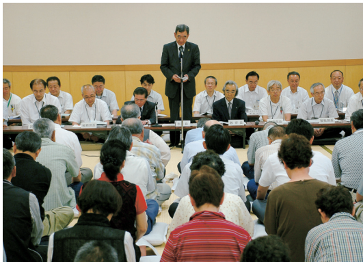
▲6/29 北部コミュニティセンターでの住民懇談会。