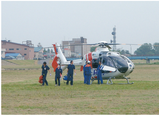
▲岩木川河川敷に着陸したドクターヘリ。消防署が警戒活動をしている際は近づかないで！

離着陸時には消防署でも離着陸場の警戒にあたりますが、強いダウンフォース（プロペラによる下方への風圧）も発生し、転倒などによるケガ等の可能性がありますので、消防署で警戒活動をしている間は、離着陸場には近づかないようお願いいたします。