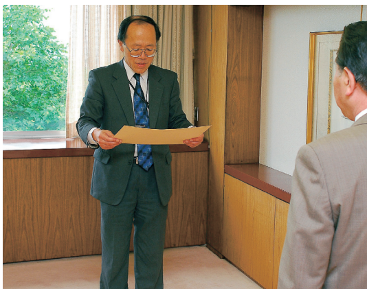
▲副市長に表彰状を伝達する大蔵情報通信部長