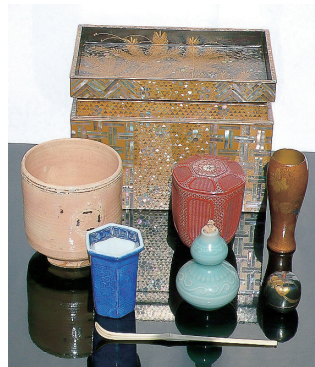
尾州徳川家伝来 茶箱

■日時 7月2日(土)・3日(日) 10:00~12:00/13:00~15:00 鑑定は、午前・午後、各50名程度、2日間で計200名程度を予定しています。