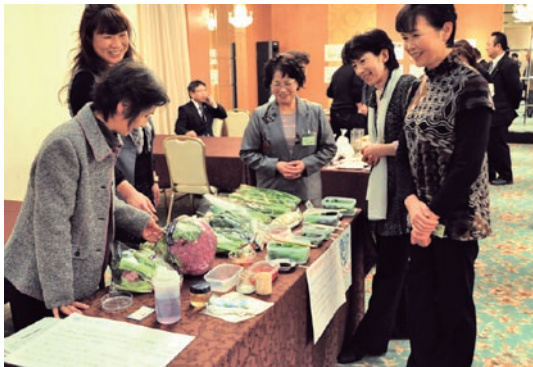
▶生産者との交流も