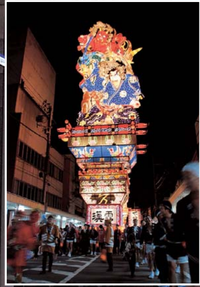
▲今年で最後となる「不撓不屈」。東京ドームや皇居に出陣しました。