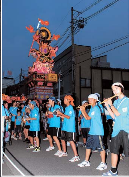
▲創立 50 周年を記念し出陣した南小学校。