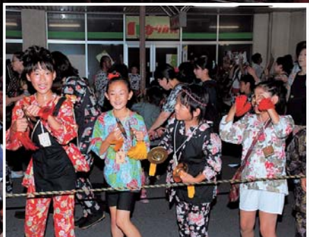
▲「ヤツテマレ〜」元気いっぱいの子どもたち。