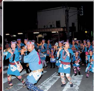
▲囃子が観客を盛り上げます。