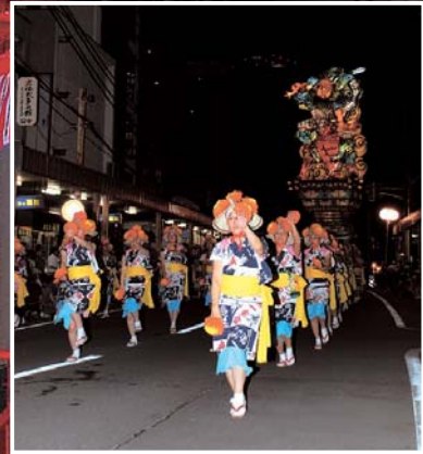
▲華麗な流し踊りに導かれ「夢幻破邪」がまちを練り歩きます。