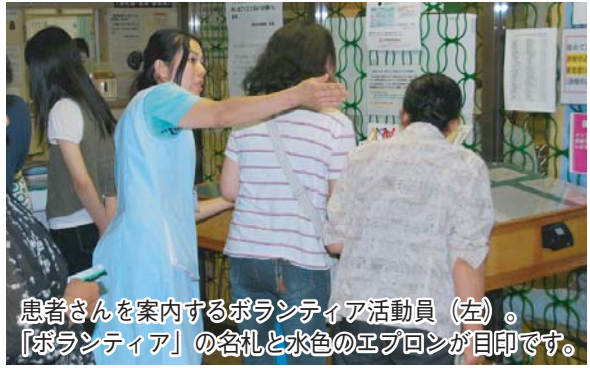
患者さんを案内するボランティア活動員（左）。「ボランティア」の名札と水色のエプロンが目印です。

西北中央病院では、7月5日から、ボランティアによる患者への援助活動を始めました。