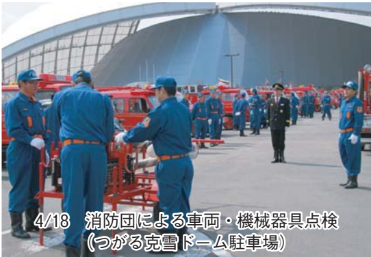
4/18 消防団による車両・機械器具点検 (つがる克雪ドーム駐車場)

春は空気が乾燥するため、火災に特に注意が必要です。この時期にあわせ市内で様々な防火PRが行われました。火災のない安全なまちをみんなの手で！