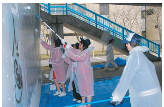
▶落書きを塗り消す五一中学生