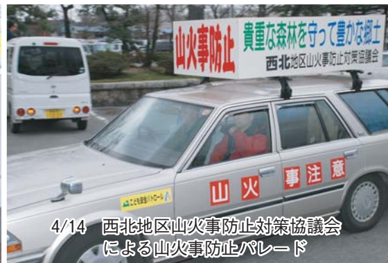
4/14 西北地区山火事防止対策協議会による山火事防止パレード