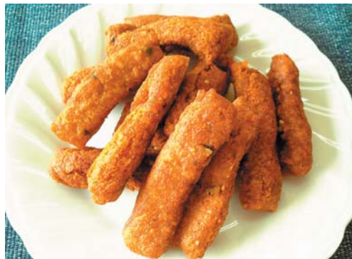
1個分 296kcal 塩分 0.3g