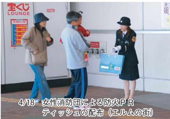
4/18 女性消防団による防火PR ティッシュの配布(エルムの街)