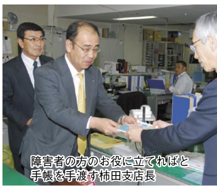
障害者の方のお役に立てればと 手帳を手渡す柿田支店長