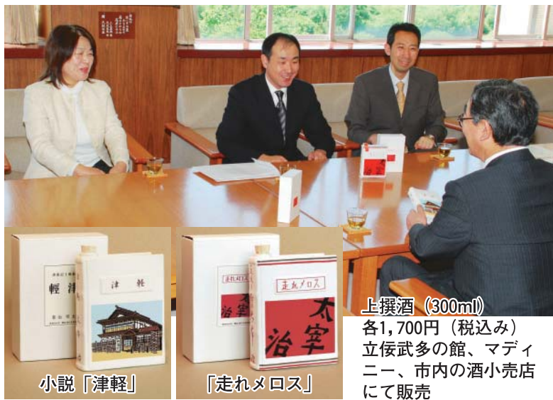
上撰酒 (300ml) 各1,700円(税込み) 立佞武多の館、マディニー、市内の小売店にて販売

同協議会は、大町にある太宰治ゆかりの蔵を集客施設として再生しようと活動し、日本酒は「蔵」と「走れメロスマラソン」をPRするものです。ボトルは本の形をした陶器製で、既に竹浪酒造店から発売されている「小説「津軽」」も同様に販売。菊池理事長は「飲んで楽しみ、その後はボトルを飾って楽しむ」とお土産として高い期待を寄せていました。