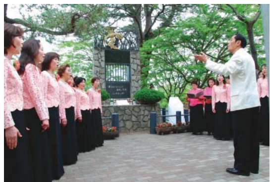
▶文学碑をつつむ「チェリーコール」の歌声