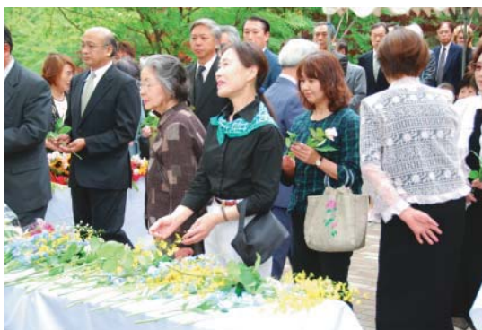
▶太宰とその作品に想いを寄せながら献花の列が続く