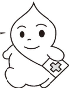
青森県の献血キャラクター 「ブラット君」

青森県では、 慢性的に 輸血用血液が 不足しています。 みなさん 献血に 協力してね!