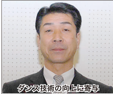
ダンス技術の向上に寄与

ダンス教室(タザワ・ダンス・ルーム)を開設以来、33年間に渡ってダンスを文化として普及させてきた。プロフェッショナル競技選手として、15年間技術向上の推進力となった。