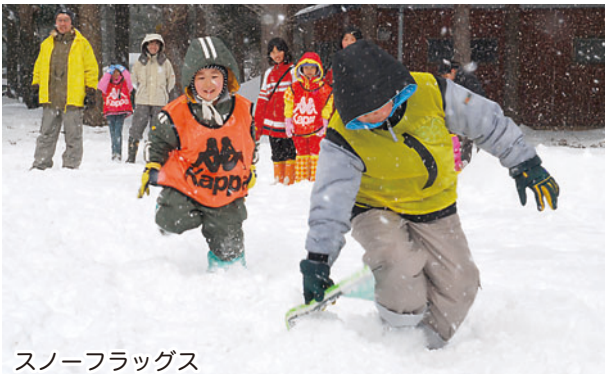
スノーフラッグス

フェスティバル前半の二月九日から十一日までの三日間は、アンパンマンやドラえもんなどの雪像三十五基を制作。後半の二月十七日には雪上運動会を行い、旗とりゲームのスノーフラッグスやムカ