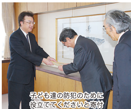
子ども達の防犯のために役立ててくださいと寄付