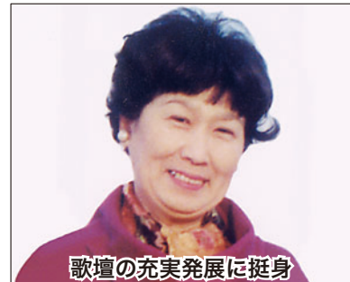
歌壇の充実発展に挺身

生け花教室を開き、指導者として長きにわたって後進の指導育成に尽力。市総合文化祭への積極的参加など地域文化の醸成に寄与し、華道を通じて当市の文化振興、発展に貢献された。