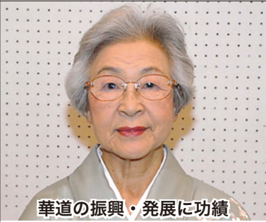
華道の振興・発展に功績

ダンス教室(ナリタダンススクール)を開設以来、16年間文化としてのダンスを地域に定着させた。多くの競技会に出場し、長期の実績をもつ。ダンス技術のレベルアップに貢献された。