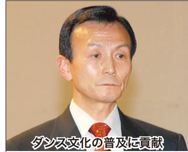
ダンス文化の普及に貢献