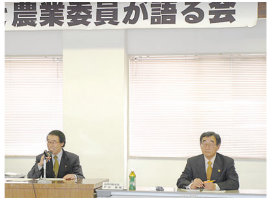
農業委員が語る会

五所川原市農業の方向性を見出すため、市長と農業委員が語る会が二月二十日開催されました。出席した農業委員からは、「米価の下落、燃料や農業資材の高騰など、農業経営は非常に厳しい状況に置かれている。地産地消、食の安全という観点からも、学校給食に地域で生産された米や野菜を積極的に取り入れて欲しい」「米の生産調整への非協力者に対して、行政からも厳しいペナルティを科して欲しい」「わら焼きを無くすための有効な対策は?」「水利費、土地改良費の未納問題に、行政として何らかのアドバイスが出来な