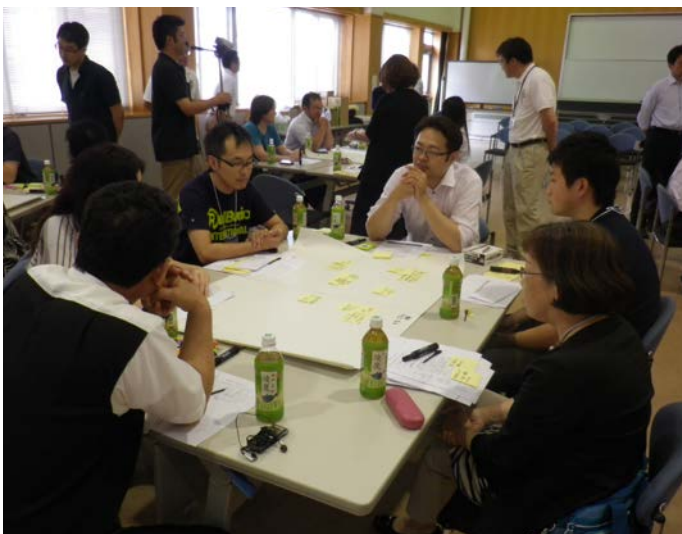
昨年度の市民討議会