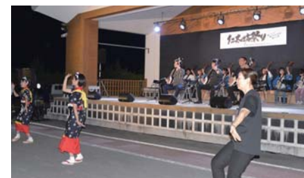
フィナーレは出演者による大合奏