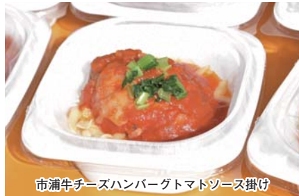
市浦牛チーズハンバーグトマトソース掛け