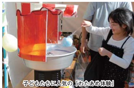
子どもたちに人気の「わたあめ体験」