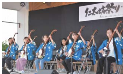
真剣に演奏する金木小学校三味線クラブの児童

金木小学校の児童は「手拍子をしてもらえてうれしかった」「みんなと合わせて演奏できた」、金木中学校の生徒は「楽しんで演奏できた」「緊張したけれど頑張れた」と笑顔で話しました。