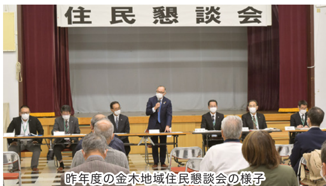
昨年度の金木地域住民懇談会の様子

市長をはじめ市職員が、テーマを中心に皆さんと意見を交換する対話形式で行います。市民の皆さんはぜひご参加ください。