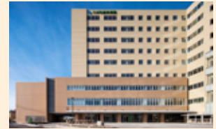
バスで目的地に到着