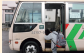
タクシーからバスへ