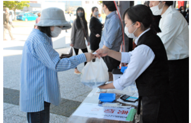
自慢のお弁当を手渡す店員