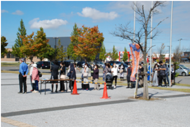
販売開始前から列をつくるお客さん

10月28日には、お酒のおつまみに商品を限定した「おつまみ市」も開催され、お店に行ってみたく思えるような自慢のメニューが多数販売されました。