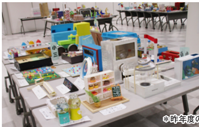
※昨年度の美術展の様子