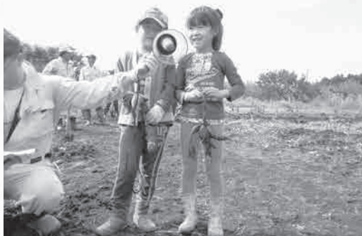
感想発表する園児たち

十月三日、ひまわり幼稚園、富士幼稚園、長橋保育園、V.I.C.ウーマンおよび八晃園ほか関係機関から合せて百三十名が参加し、松野木地区の畑でさつま芋の収穫作業をしました。 この活動は、市内にある遊休農地を活用し、子どもたちに自然環境に触れる機会と、食料と農業の大切さを教えると共に、グリーン・ツーリズムの観点から市農業委員会が実施しているものです。 農業委員から二通りの説明があり、いざ芋掘りに取り掛かると、あちこちから園児の歓声が上がリ、泥にまみれながらも生き生きとした表情で、手に持ちきれないほどのさつま芋を収穫していました。 自然の中で過ごした時間とこの体験は、園児たちにとって、とても有意義なものになったのだろうなと感じました。