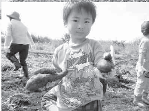
大きいでしょうと嬉しそうに話す園児