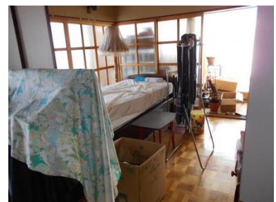
2階 洋室 (6畳)