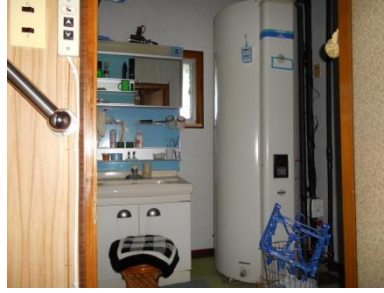
1階 洗面脱衣、温水器