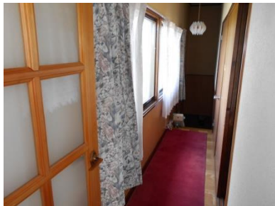
2階 廊下 (階段側)