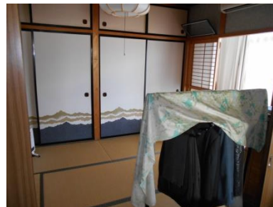
2階 和室 (6畳)