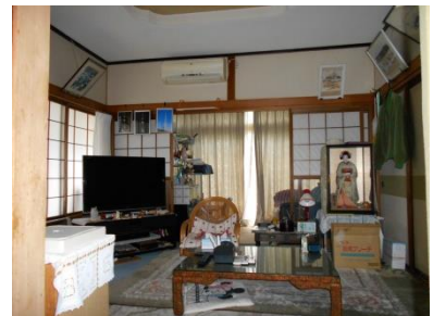
1階 洋室 (8畳)