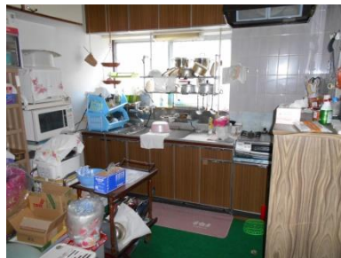
1階 キッチン (6畳)