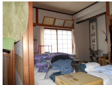
1階 和室 (6畳)