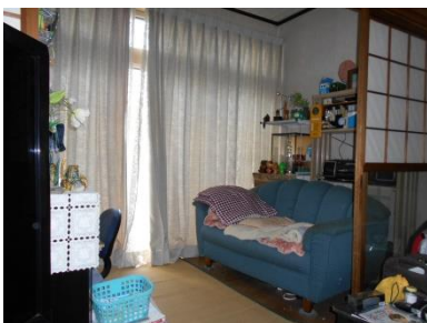
1階 洋室 (4畳)