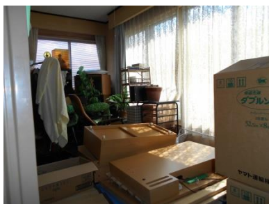
2階 洋室 (9畳)