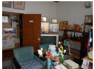
1階 洋室 (6畳)