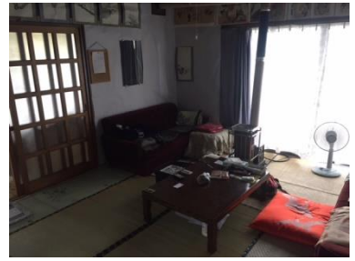
1階 和室 (10帖)