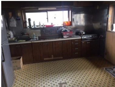
1階 DK (10.5帖)