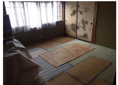
1階 和室 (6帖)