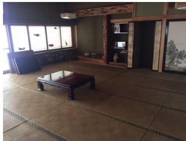
1階 和室 (28帖)