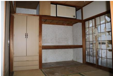
1階 和室 (4.5帖)