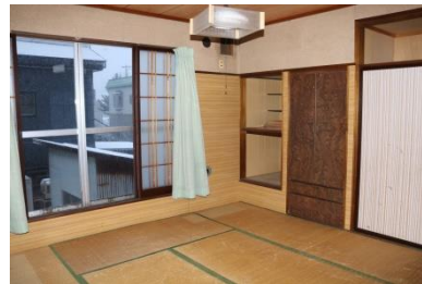
2階 和室 (8帖)