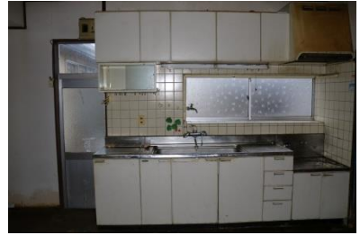
1階 DK (7.5帖)