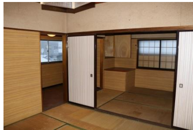
2階 和室 (5.5帖)