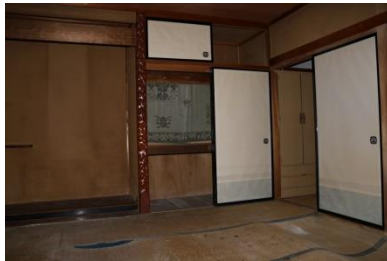
1階 和室 (8帖)