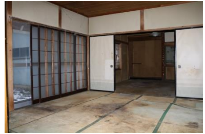
1階 和室 (8帖)