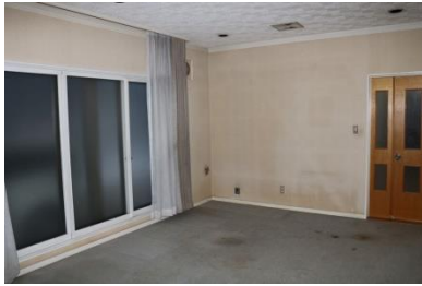
1階 洋室 (12帖)