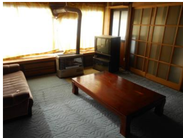
居間 12 畳