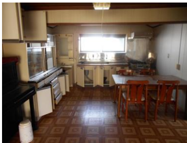
DK 12 畳