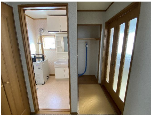
洗面脱衣室・洗濯機置き場